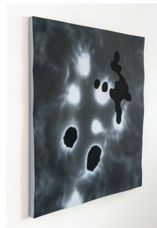
Sylvain Azam: Omatidium, 2017. Acrylique sur toile, 9 2 x 82 cm. © Sylvain Azam. photo : studio141

Ces deux géants, structures-écrans sur pieds et entoilés de résilles imprimées de motifs, ont l'apparence de monstres "rétiens" sortis d'une série de science-fiction. Leurs formes courbes contraignent la circulation, leurs surfaces résillées créent une mise à distance brumeuse avec le réel et leurs motifs se déploient en ombres portées fantomatiques. Ils agissent comme des filtres immersifs et perturbateurs de la lecture des tableaux de Sylvain Azam.