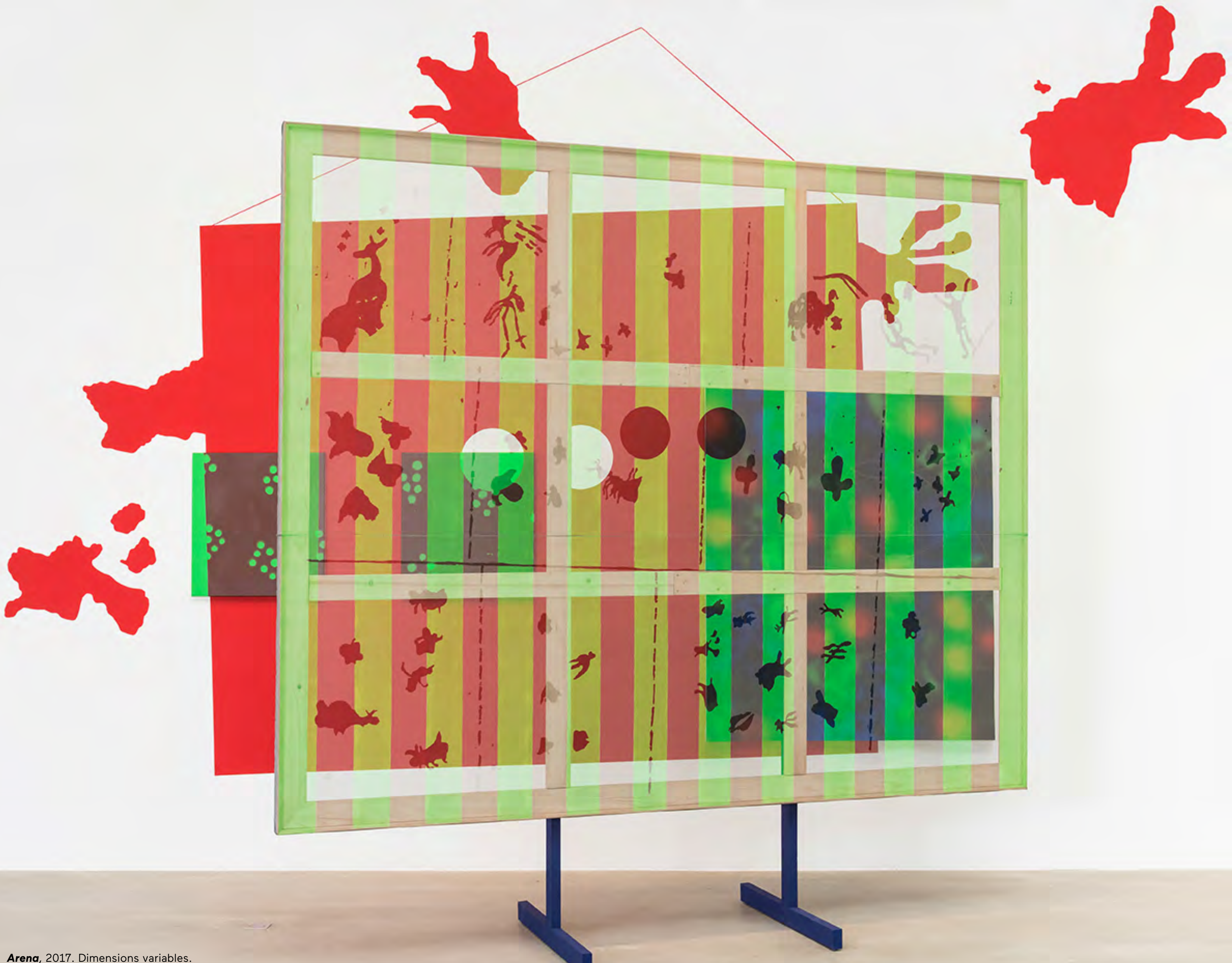
Arena , 2017. Dimensions variables. Vue de l'installation à la 67ème édition du salon Jeune Création, juillet 2017. Installation view at Salon Jeune Création, July 2017.