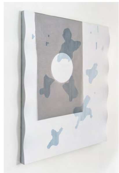
Sylvain Azam. Cueva, 2017. Acrylique sur toile, 92 x 82 cm. © Sylvain Azam. photo : studio141

qualia (/ˈkwaːliə/ or /ˈkwɛɹliə/; singular form: quale) are claimed to be individual instances of subjective, conscious experience. As qualitative characters of sensation, qualia stand in contrast to "propositional attitudes", where the focus is on beliefs about experience rather than what is it directly like to be experiencing